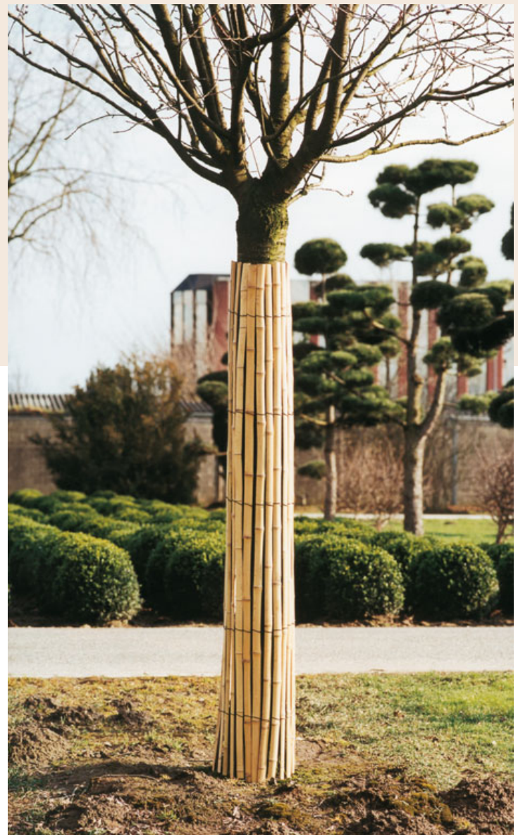
Обвязка из бамбуковых палочек